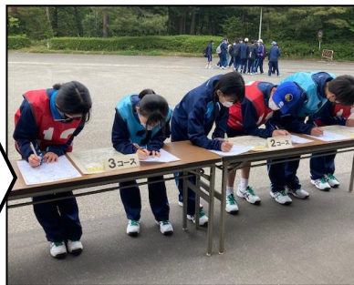
マスターマップを写し取った後、班でリエントリーングに出発しました！