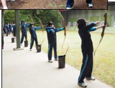
2日目は、午前中に野外活動（ディスクゴルフ、アーチェリー、サイクリング、カッター、いかだ）を行いました。