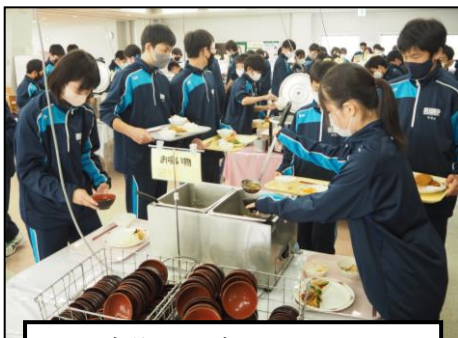
入所式後、昼食をとりました。