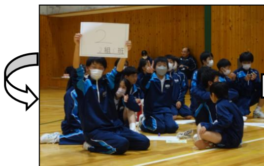
夕食後、学年レクリエーションをしました。