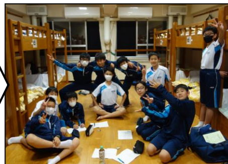
入浴、班会議後、22:30消灯でした。