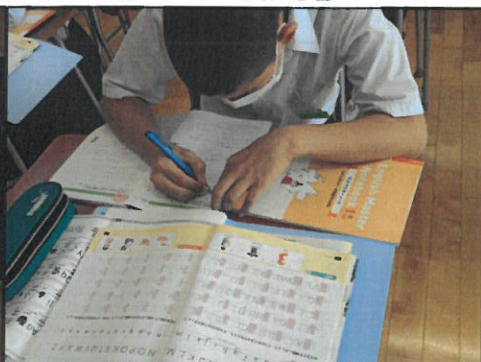
英語担当の先生から「アルファベットの小文字は書く位置に気をつけよう。」とアドバイス。