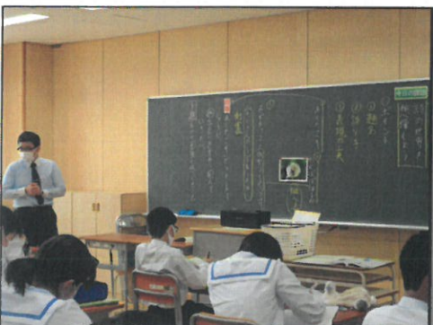
国語では、詩を鑑賞するには、文章表現や題名の付け方に注目することがポイントだと学習。