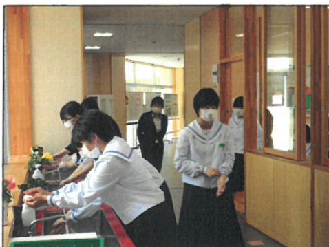
給食前には手洗いタイム。1人30秒を目安にしっかり洗っています。