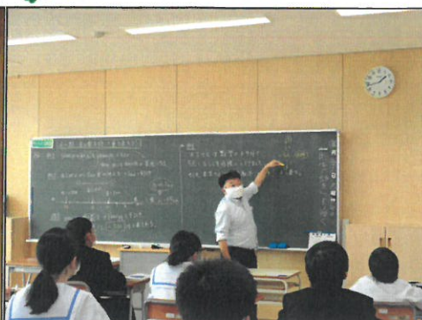
数学は正負の数について例を挙げて説明。それを聞きながら理解を深めました。