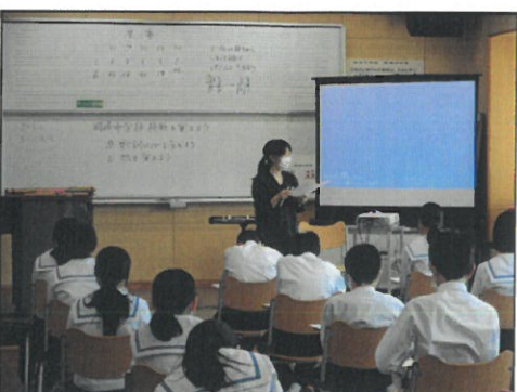
感染防止のため、校歌はまだ歌えないので、歌詞の意味を考え、リズムを手拍子でとりました。