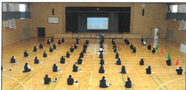
保健体育の授業内容説明は、体育館で2m以上開けて着座して話を聞きました。このあと5月中は実技をせず、教室で保健授業を行いました。