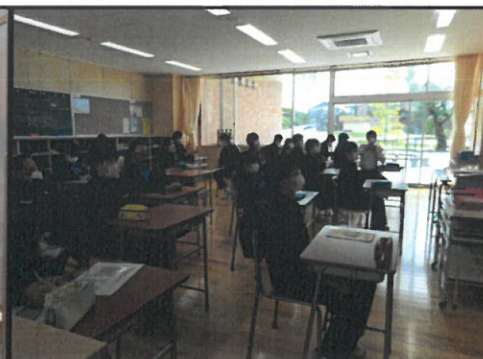
座席は市松模様に配置して、互いの距離を離しています。