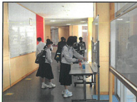
登校したら、すぐ手を消毒。玄関や教室前に消毒液を置いてあります。