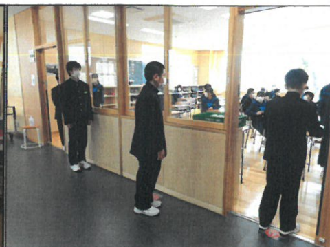
給食の受け取りはセルフサービスで。ソーシャルディスタンスを守って並んでいます。