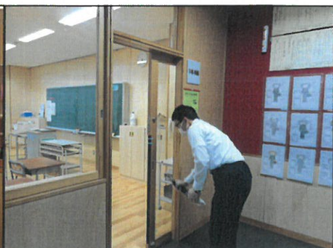
放課後は、職員総出で教室の机・椅子・扉、トイレの扉などを消毒しています。